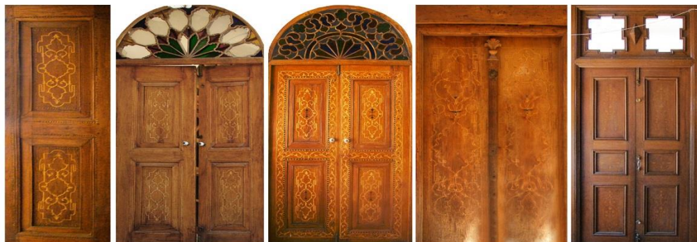
۱۲. درب تالار خانه حسنی اردکانی ۱۳. درب ورودی خانه منطقی نژاد ۱۴. درب تالار خانه منطقی نژاد ۱۵. درب ایوان خانه منطقی نژاد ۱۶. درب مجاور تالار خانه منطقی نژاد

تصویر ۲- درهای چوبی موجود در خانه‌های قاجار شیراز