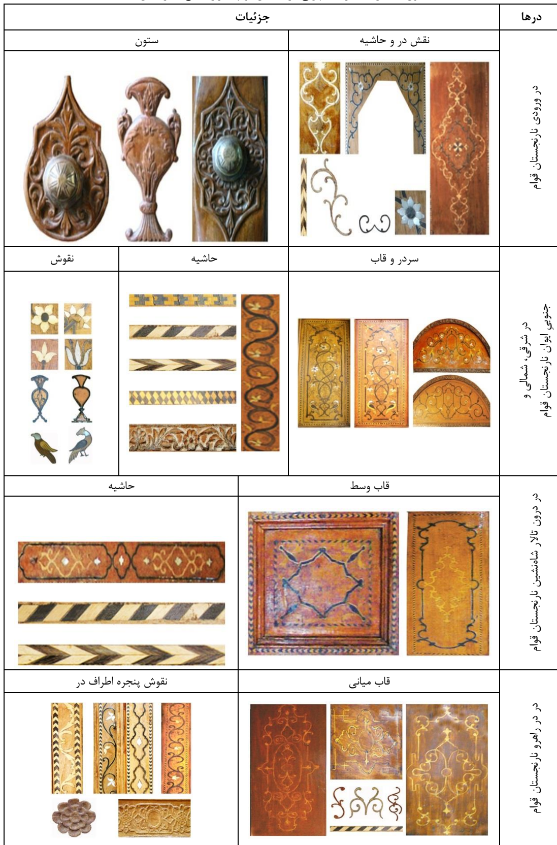
جدول ۳- جزئیات درهای چوبی نارنجستان قوام شیراز