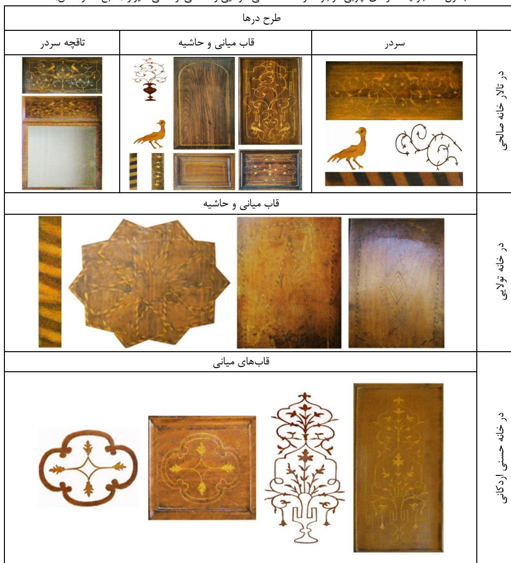
جدول ۵- جزئیات درهای چوبی موجود در خانه صالحی، تولایی و حسنی اردکانی شیراز (منبع: نگارندگان)

گل‌های ختایی کار شده و جوک ساده‌ای دور این قاب‌ها و حاشیه در کشیده شده است. پشت این کاملاً ساده و بدون نقش است و تنها جوک است که بر روی آن خودنمایی می‌کند. جدول (۵). این سبک تزئین-گری درها در بناهای مذهبی و غیرمذهبی مشابه بوده است که در بناهای مذهبی و مساجد کمی پرکارتر کار شده است.