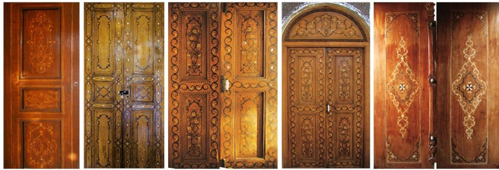
۱. درب ورودی نارنجستان قوام ۲. درب شرقی ایوان نارنجستان قوام ۳. درب شمالی و جنوبی ایوان نارنجستان قوام ۴. درب درون تالار شاه نشین نارنجستان قوام ۵. درب راهرو نارنجستان قوام