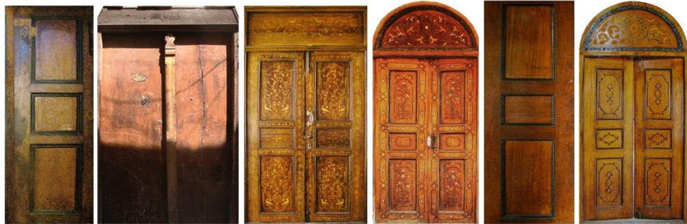
۶. درب اتاقی خانه زینت الملک ۷. درب درون اتاقی خانه زینت الملک ۸. درب ایوان خانه زینت الملک ۹. درب خانه صالحی ۱۰. درب خانه سعادت ۱۱. درب خانه تولایی