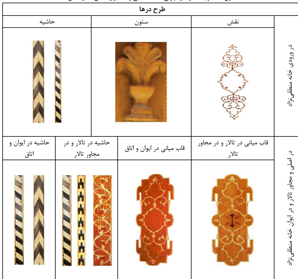
جدول ۶- جزئیات درهای چوبی خانه منطقی‌نژاد شیراز

درهای خانه منطقی‌نژاد از جمله درهای زیبا و پرکار مربوط به دوره قاجار است. در ورودی این بنا با بندهای گردان، قرینه‌سازی دورانی و طرح ختایی به صورت قرینه انعکاسی تزئین شده است. منبت کوچکی نیز به شیوه استیل کار شده که مابین دو لنگه در قرار دارد. چون جوک از هنرهای متداول دوره قاجار بوده، بر روی این در نیز از دو نوع تزئینات جوک‌کاری استفاده شده است. این خانه یک تالار دارد با دو در معرق کاری شده بسیار زیبا که هر دو از نظر نوع چوب و طرح، کاملاً یکی هستند. طرح قاب میانی این درها،