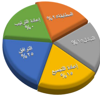
الرسم البياني الدائري رقم ١ للنسبة المئوية لعناصر الترجمة في ترجمة محمد حزائني زاده

وفي المثال الثالث، لم يهتم المترجم بترتيب الكلمات في الترجمة وجاء الفعل قبل المفعول به، هذا إذا كان المفعول به يأتي قبل الفعل بالفارسيّة. إعادة الترتيب للعبارة المذكورة في الفارسيّة هو عبارة عن: (خودم را به او می چسباندم)، والتي تُركت بعيداً عن أعين المترجم. والتحدّي الأكبر في مجال التركيب هو مسألة بنية الجملة أو نظامها؛ لأن اللغة ليست مجرد مجموعة من الكلمات والعبارات ونرى أيضاً وجود المركبات فيها. ويختلف نوع تكوين كل لغة عن لغة أخرى، وبالتالي، يجب أن يكون المترجم على دراية كاملة بخصائص التكوين في كل من لغتي المصدر والمستهدفة ١ .