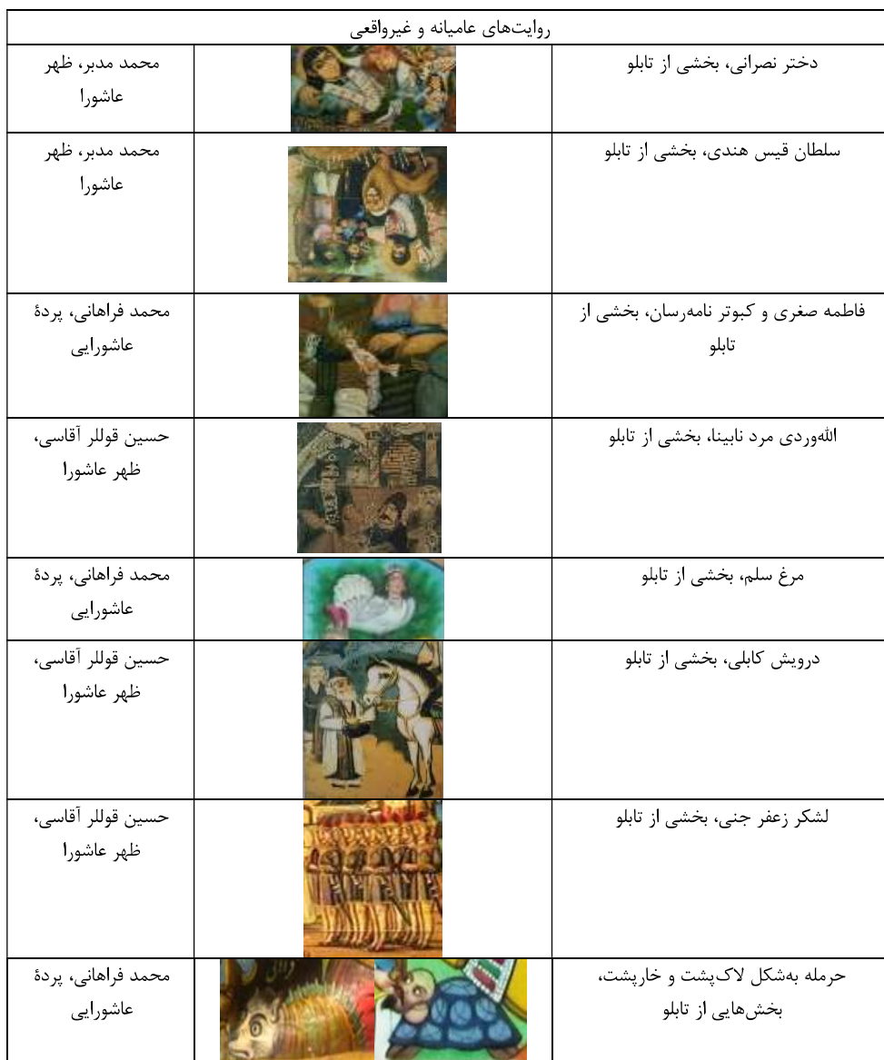
جدول ۵- روایت‌های عامیانه در پرده‌های خیالی‌ساز عاشورایی (منبع: نگارندگان)