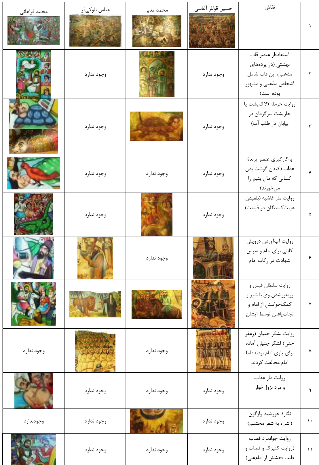
جدول ۶- عناصر روایی غیرواقعی در نقاشی‌های قهوه‌خانه‌ای