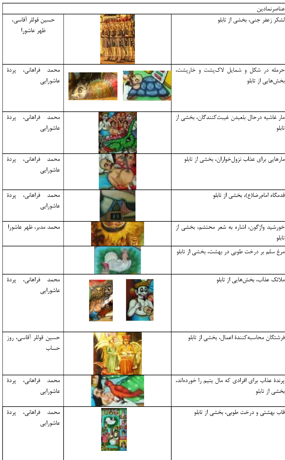
جدول ۴- عناصر نمادین در پرده‌های خیالی‌ساز عاشورایی