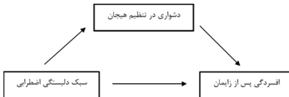
شکل ۱) مدل مفهومی پژوهش