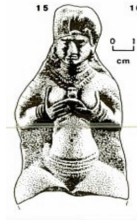
تصویر ۵- نقش برجسته قالبی یک زن از دوران عیلام میانی، محل نگهداری: موزه ملی ایران (منبع: مجیدزاده، ۱۳۸۶: تصویر ۵۱)

پوشاک سنتی ساکنان غرب ایران، همچون پوشاک سنتی سایر نقاط، دارای سه وجه سرپوش، تن‌پوش و پاپوش است. سرپوش‌های زنان و مردان منطقه، سابقه بسیار طولانی دارند. برای مثال، کلاه‌های عرقچین مانند و نوک‌تیز نازک و ضخیم از پارچه و نمد کردها که معمولاً دور آن‌ها را پارچه‌های کلاغی یا کلاهی می‌پیچند، یادگاری از کلاه‌های زمان مادها و هخامنشیان و قدیم‌تر از آن هستند که به تدریج تحول یافته و به این شکل درآمده‌اند (ضیاءپور، ۱۳۴۹: ۱۰۶). زنان این منطقه نیز انواع گوناگونی از سرپوش‌ها را بر سر دارند که در هر استان، متفاوت با دیگری است و اجزای گوناگونی (روسری، سربند، کلاه و گاهی عمامه، چارقد و چادر) را در بر می‌گیرد. سرپوش زنان کردستان شامل عمامه یا کلاه و سربند است که از چند پارچه ابریشمی تشکیل می‌شود و به طرق گوناگون بسته می‌شود (همان، ۱۳۴۶: ۲۴). سربند بانوان منطقه کرمانشاه نیز از چند دستمال بزرگ کلاغی ریشه‌دار تشکیل شده که دور کلاهکی پیچیده می‌شوند. گیسوان زنان در زیر این سربندها به دو طرف صورت رها می‌شوند (همان: ۲۷). این سرپوش‌ها اجزا و انواع گوناگون دارند. با توجه به اینکه در این