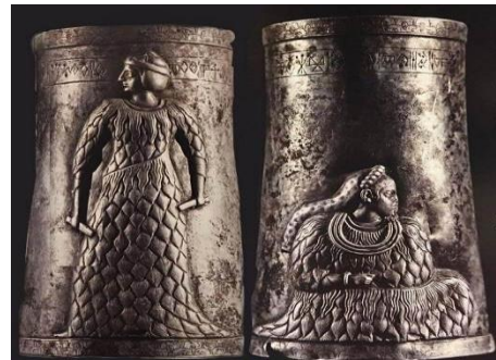
تصویر ۱- جام نقره مرودشت ۳۲۰۰ ق.م، محل نگهداری: موزه ایران باستان

یحیی ذکاء درباره تن‌پوش این نقش برجسته می‌نویسد: «درباره چگونگی دوخت جامه این بانوان و تندیس‌های دیگری که از بزرگان و ملکه‌های عیلامی به دست آمده، عقاید گوناگونی اظهار شده است. برخی با توجه به نقش و شیارهای پشم‌گونه‌ای که بر روی جامه‌ها دیده می‌شود، آن‌ها را از پوست و کسانی آن‌ها را از جنس دیگر و به تقلید از پوست و گروهی آن‌ها را از برگ یا الیاف گیاهان می‌دانند» (ذکاء، ۱۳۵۲: ۱). سربند این زن به شکل نواری دور موها بسته شده است (تصویر شماره ۱).