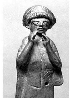
تصویر ۷- پیکرک زن، دوران عیلام میانی موزه متروپولیتن و بازسازی گرافیکی آن توسط ماریا باژاتارنیک ۱