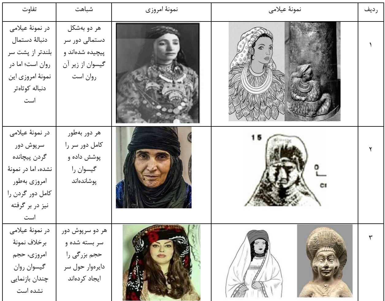
جدول ۱- مقایسه نمونه‌های عیلامی با نمونه‌های امروزی

اصالت این نوع پوشش را نشان می‌دهد. این نوع پوشش که نماد فرهنگ سنتی زنان این منطقه است، در هجوم هزاران مبادله فرهنگی، طی قرون متمادی، همچنان زیبایی و اصالت خود را حفظ کرده و اگرچه در طول زمان، دچار تحول و دگرگونی شده، نمای کلی خود را نگه داشته است.