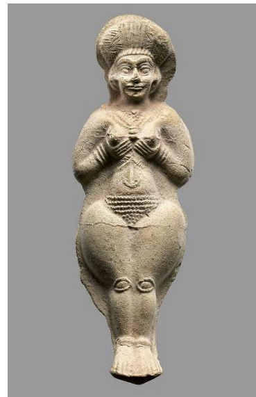
تصویر ۶- پیکرک زن، دوران عیلام میانی، موزه متروپولیتن