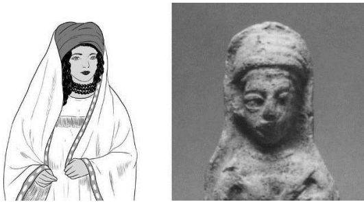
تصویر ۸- پیکرک زن، دوران عیلام میانی، موزه لوور و بازسازی گرافیکی آن توسط ماریا باژاتارنیک