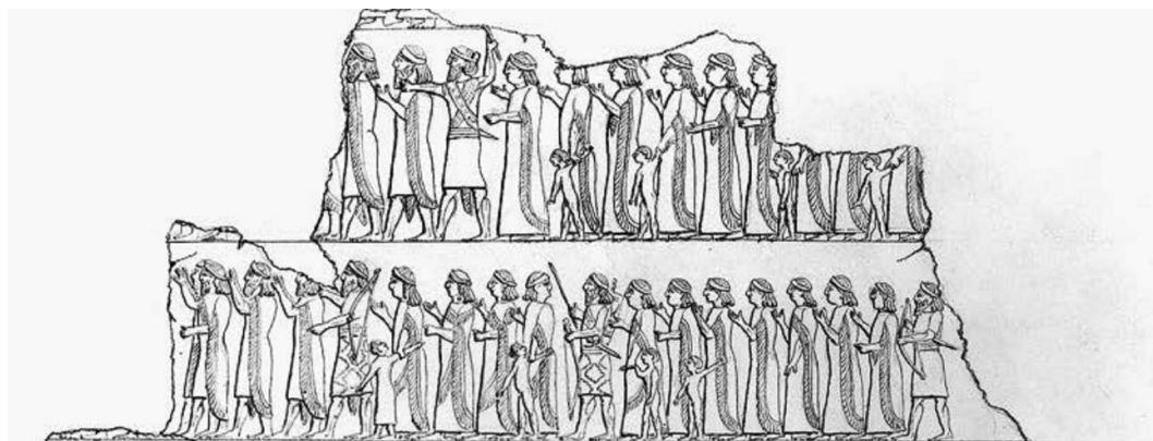
تصویر ۴- اسرای عیلامی نقر در کاخ جنوب غربی نینوا، موزه بریتانیا (Garrison, ۲۰۱۱, pp. ۳۹۲, fig. ۲۸)

نمونه دیگری از این سرپوش‌ها بر سر پیکرکی از طبقه نیايشگران دیده می‌شود که مربوط به دوران عیلام میانی و از جنس برنز است و در موزه متروپولیتن نگهداری می‌شود. سرپوش این زن، دستاری است که دورتادور سر پیچیده شده و بخشی از گیسوان او از زیر آن مشخص است (تصویر شماره ۷).