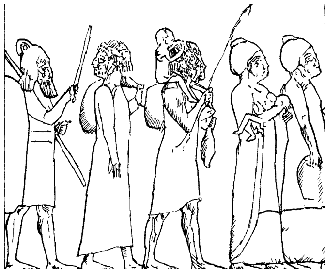
تصویر ۳- تصویر اسرای عیلامی از هامانو، کاخ شمالی نینوا، موزه بریتانیا (Root, ۲۰۱۱, pp. ۴۴۲, fig. ۱۶)